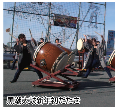
黒潮太鼓新年初だたき