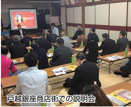
戸越銀座商店街での説明会

管理する複合商業施設。実物大ガンダムが中庭で来場者を迎える。コンセプトは「劇場型都市空間」。話題のメイド喫茶も体験可能。