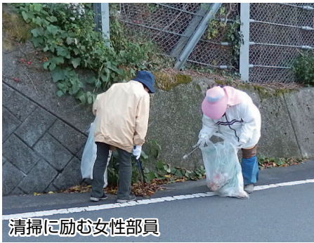
清掃に励む女性部員